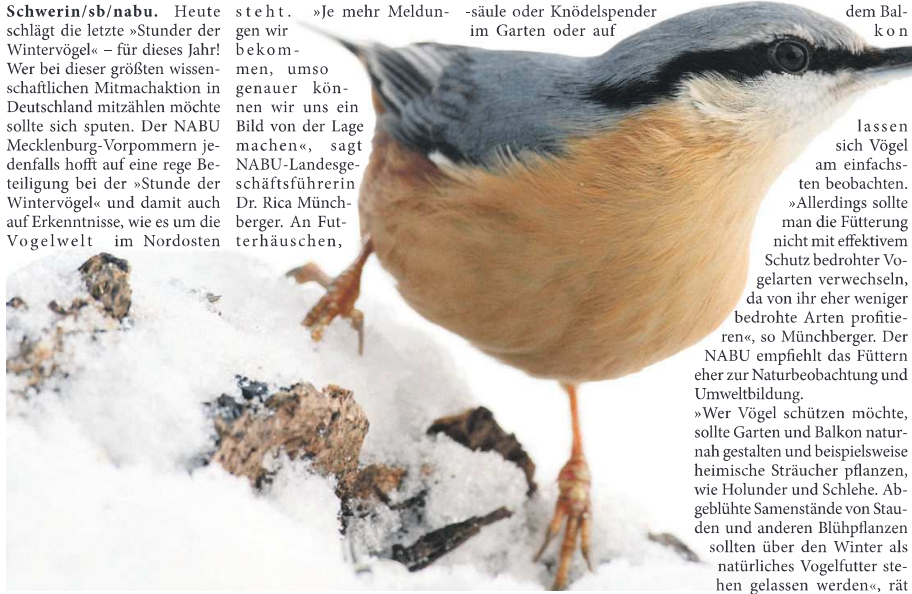
Kleiber auf der Suche nach Futter.

Wer mitmachen will, beobachtet eine Stunde lang die Vögel am Futterhäuschen, im Garten, auf dem Balkon oder im Park und meldet die Ergebnisse dem NABU. Von einem ruhigen Beobachtungsplatz aus wird von jeder Art die höchste Anzahl Vögel notiert, die im Laufe einer Stunde gleichzeitig zu sehen ist. Die Beobachtungen können per App unter www.NABU.de/vogelwelt , unter www.stundederwintervoegel.de oder unter www.NABU.de/onlinemeldung bis zum 17. Januar gemeldet werden. Zudem ist für telefonische Meldungen am heutigen 9. Januar von 10 bis 18 Uhr die kostenlose Rufnummer 0800 1157-115 geschaltet.